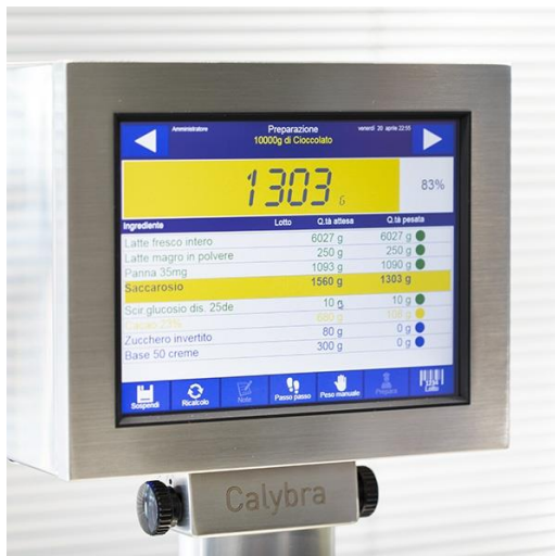
ELENCO DEGLI INGREDIENTI